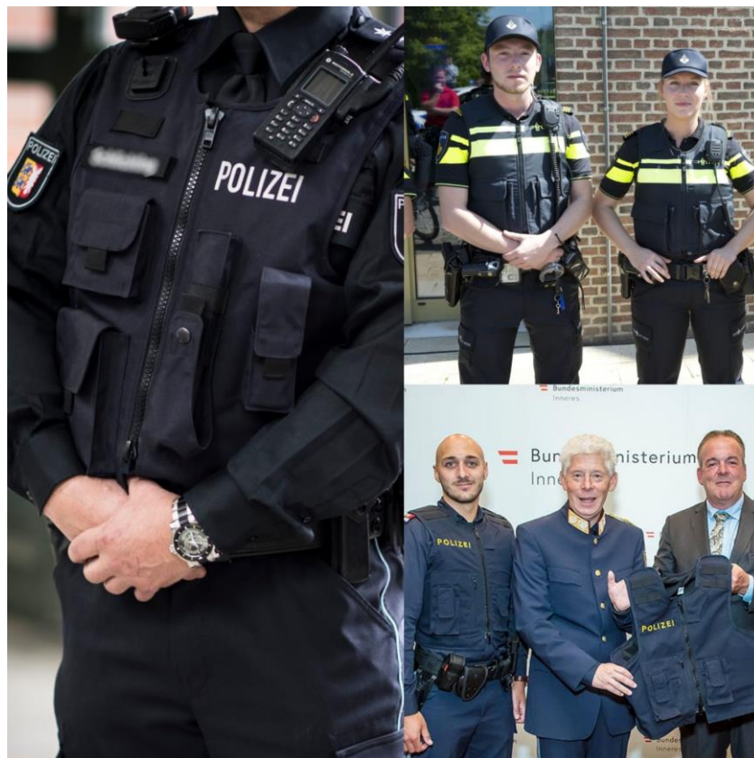
Figura nr. 11