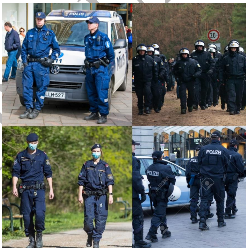
Figura nr. 12