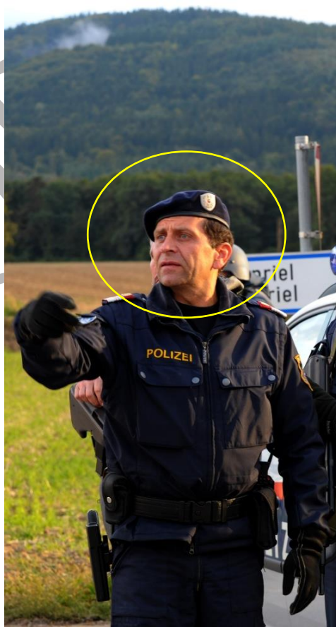
Figura nr. 4