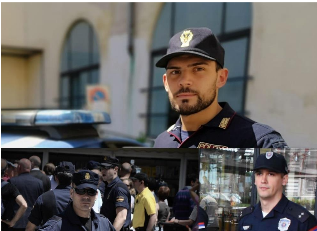
Figura nr. 3