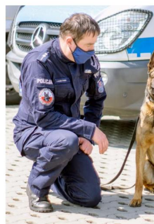
Figura nr. 10

Biroul Executiv Central al SIDEPOL CIF: 34519852 / Tel. : 0762.262.295 / E-mail: sidepol@yahoo.com Adresă corespondență: Str. Vulturi, nr. 19, Craiova, Dolj www.sindicatulpolitistilor.ro