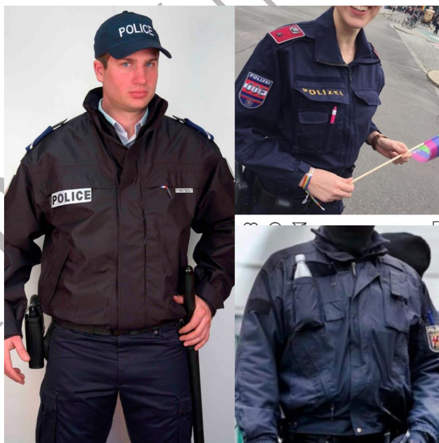
Figura nr. 6

Biroul Executiv Central al SIDEPOL CIF: 34519852 / Tel. : 0762.262.295 / E-mail: sidepol@yahoo.com Adresă corespondență: Str. Vulturi, nr. 19, Craiova, Dolj www.sindicatulpolitistilor.ro