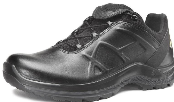
Figura nr. 8

Biroul Executiv Central al SIDEPOL CIF: 34519852 / Tel. : 0762.262.295 / E-mail: sidepol@yahoo.com Adresă corespondență: Str. Vulturi, nr. 19, Craiova, Dolj www.sindicatulpolitistilor.ro