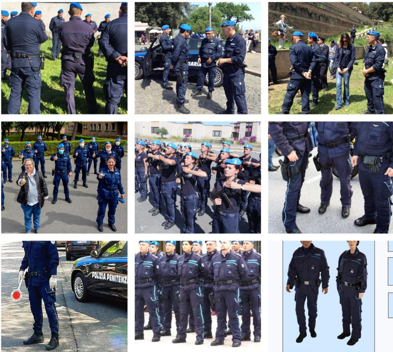
Figura nr. 13