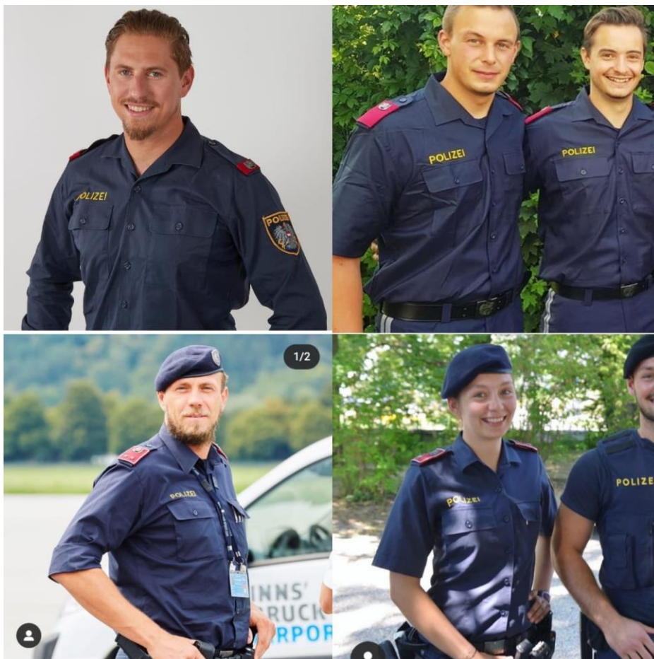
Figura nr. 7