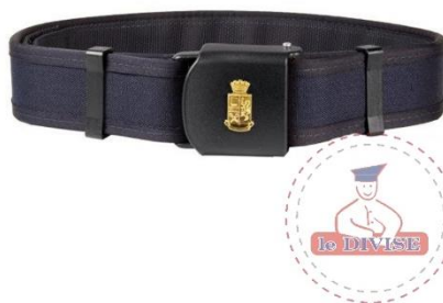
Figura nr. 14