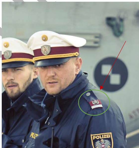
Figura nr. 2