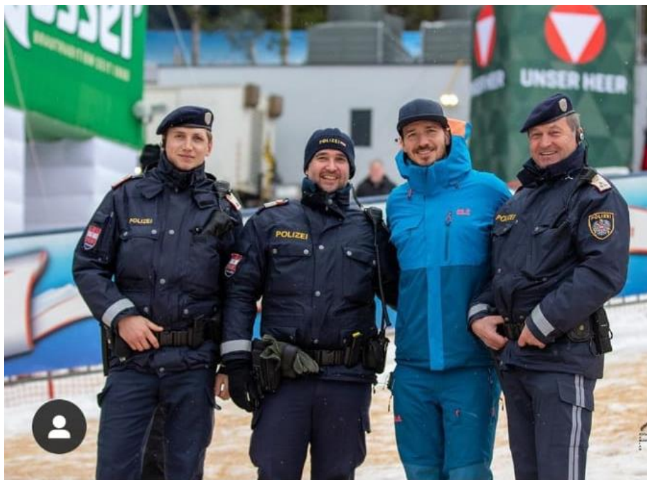
Figura nr. 5